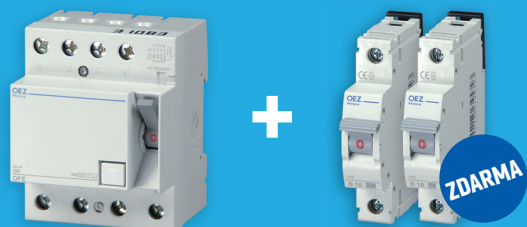
OFE-25-4-030AC kód balení: 38903