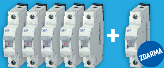
LPE-16B-1 kód balení: 38902