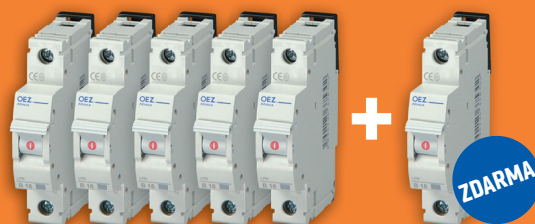
LPN-16B-1 kód balení: 38905