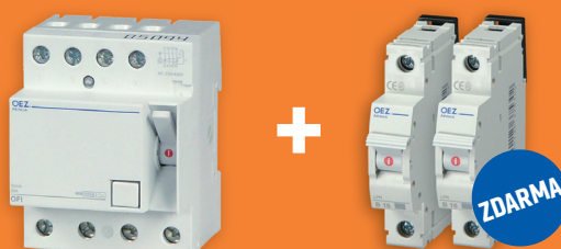
OFI-25-4-030AC kód balení: 38906